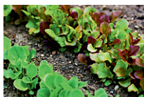
2. Semence et plantations